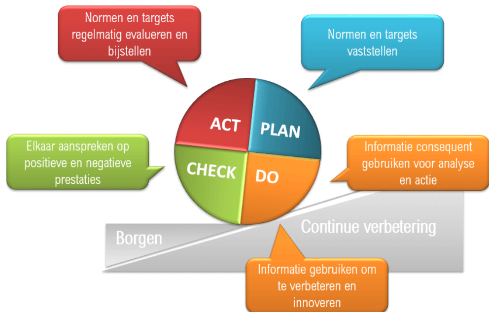
Figuur 2: Demming circle

Om de voortgang en resultaten van de vastgestelde doelstellingen te bewaken is gekozen om de Demming Circle te hanteren. Door de 4 stappen, Plan-Do-Check-Act, continu te doorlopen blijven de doelstellingen in beeld en kan er op bijgestuurd worden indien noodzakelijk. De minimale doorloop van de gehele cyclus is half jaarlijks wanneer de CO 2 -footprint wordt gescreend.